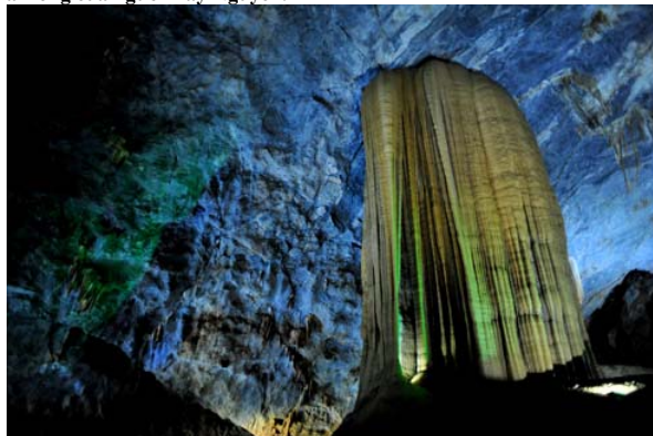
Đi trong động có thể cảm nhận được từng bước chân hay tiếng nói, cười của du khách, từng âm thanh tách bạch, vang ra đập vào các vách đá như níu kéo mọi người cùng trò chuyện.