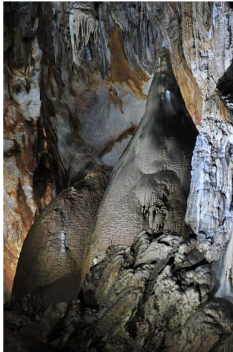
Phần lớn nền động là đất dẻo, rộng và khá bằng phẳng. Nhiệt độ trong hang luôn ở mức 20 đến 21 độ C. Chỉ đứng trước cửa cũng có thể cảm nhận được từng luồng hơi mát lạnh từ dưới động thổi ngược lên.