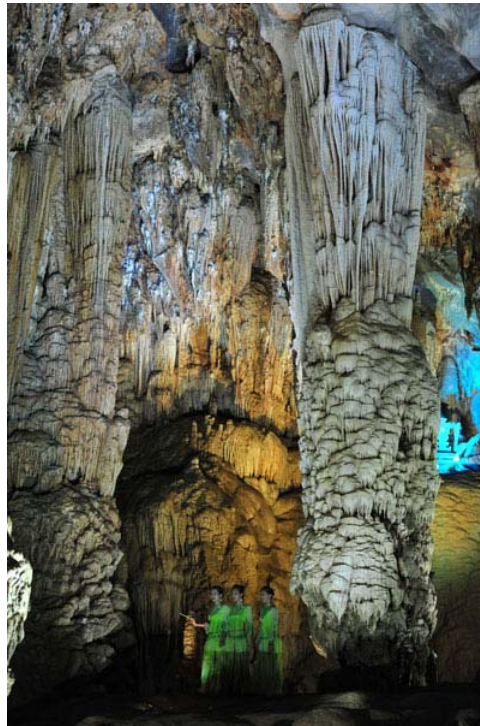
Thiên Đường có miệng hang khoảng 9m2. Trần động vút cao, rộng thênh thang. Đặc biệt, với hai cột thạch nhũ khổng lồ đường kính 5 mét vươn lên cao như những kiến trúc cột của thiên đình có nhiều hình thù phong phú.