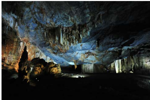
Hiện động mới chỉ khai thác và cho tham quan khoảng hơn 500 mét chiều dài do có nhiều hố sụt nguy hiểm sâu bên trong, nền động không ổn định