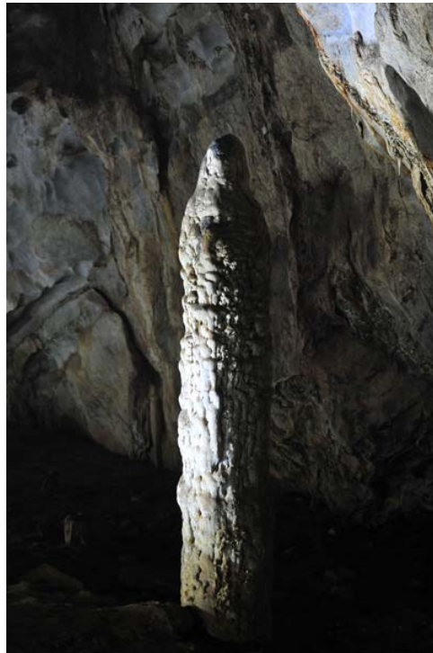
Có cả những cột nhũ lớn đường kính 1-2m giống Phật Bà Quan Am.