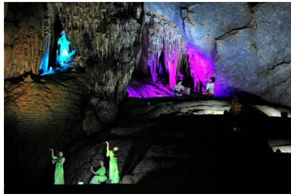
Vẻ kỳ ảo của động được tô điểm thêm bởi những nàng tiên xuất hiện trong buổi khai mạc.