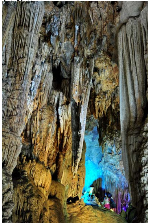
Đoạn đầu của hang là một vòm đá cao hàng chục mét, rộng khoảng 100 mét.