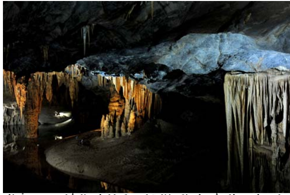
Thiên Đường còn đặc biệt bởi các cột nhũ mỡ côi. Ấn tượng nhất là một khoảng nhũ dài trải trên nền động trông như một chiếc sa bàn.