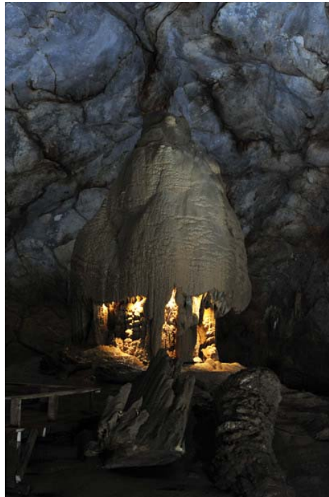
Một lớp thạch nhũ mang dáng vẻ như ngôi nhà Rông của người Tây Nguyên.