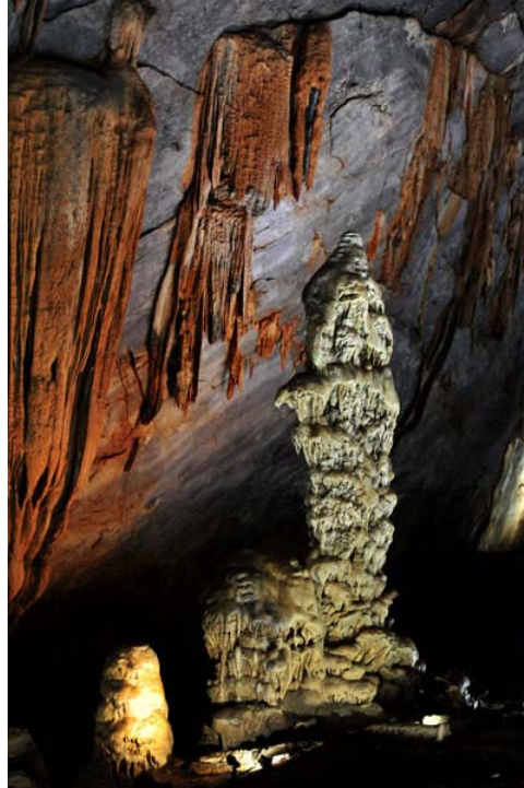
Đoạn thứ hai của hang có hàng chục ụ thạch nhũ cao từ 30 đến 60cm nằm ngay trên nền động trông rất giống các tượng phật.