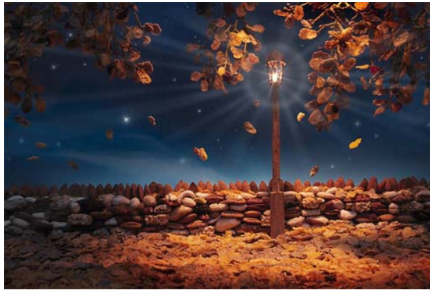
Khung cảnh đêm thu được làm hoàn toàn từ ngũ cốc.