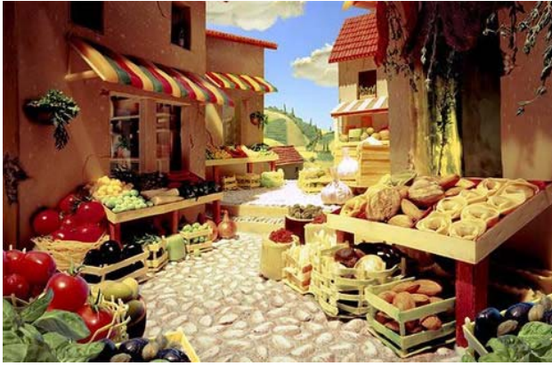
Khu chợ với rất nhiều loại rau quả.