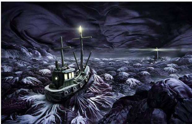
Chiếc thuyền trong đêm giông bão, khung cảnh kỳ bí này được tạo nên từ những cây cải tím.