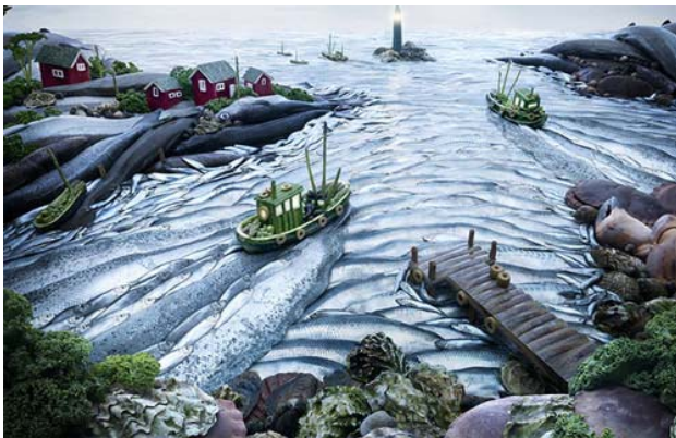
Cảng biển với những hòn đá được làm từ vỏ con hàu, cảng cua. Thuyền được làm từ bí xanh, măng tây. Sóng biển được tạo nên từ cá.