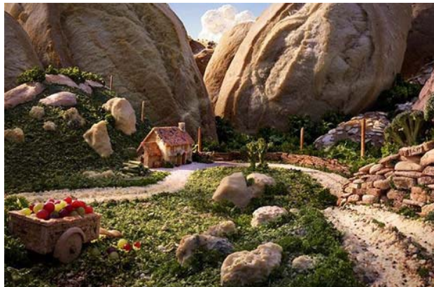
Bánh mì và bơ tạo nên một cảnh quan độc đáo.