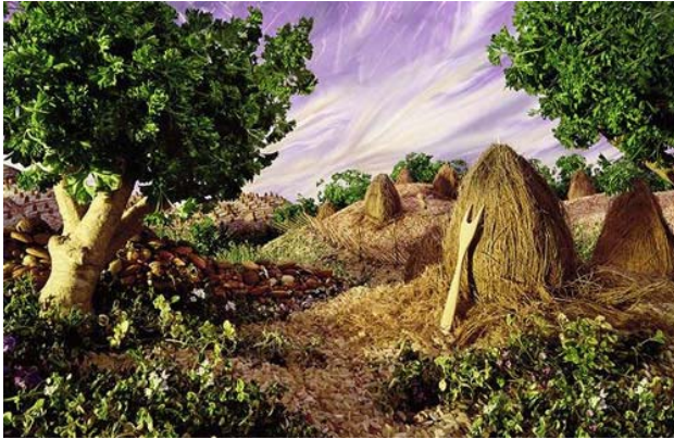
Cảnh sân trại với đồng rom làm từ quả dứa lột vỏ.