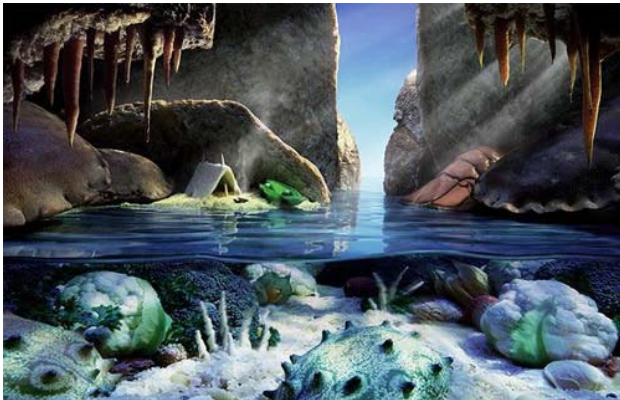
Cảnh hang động được làm từ cà rốt (như đá), súp lơ (sinh vật dưới nước).