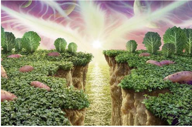
Vách núi kỳ vĩ được tạo từ bột khoai tây, kết hợp với cải xoong, bắp cải lá nhăn và bắp cải đỏ.