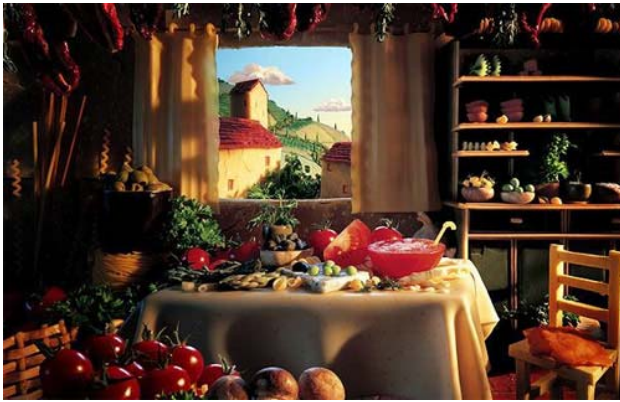
Góc bếp với rèm và khăn trải bàn được làm từ mì sợi.