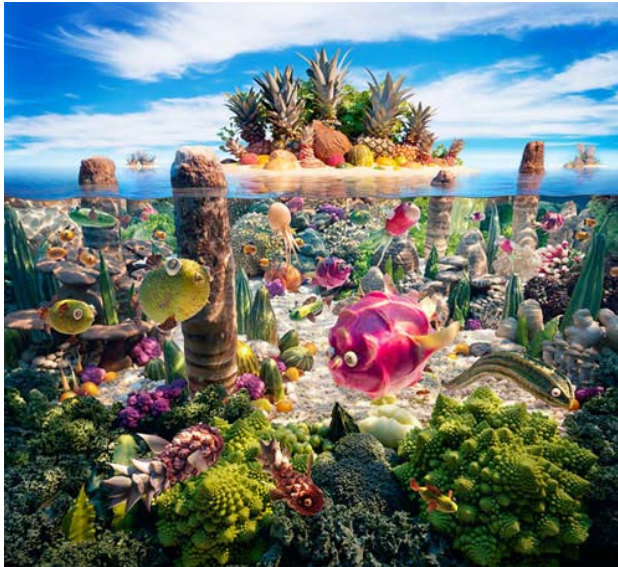
Thế giới san hô lung linh: san hô được làm từ cây súp lơ, cá làm từ các loại quả và rau, đảo là những quả dưa.