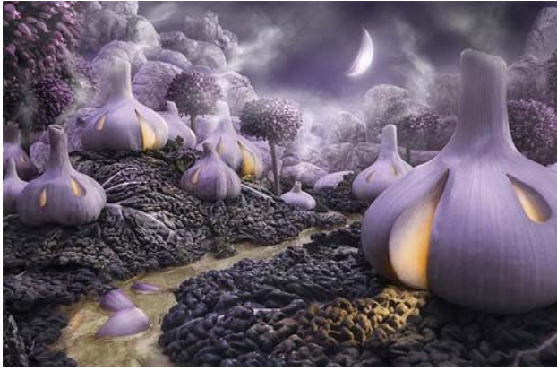
Củ tỏi và lá cải bắp biến thành khung cảnh ngôi làng với những ngôi nhà sáng đèn trong đêm