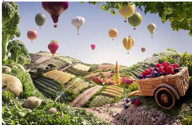
Những quả khinh khí cầu làm từ các loại quả và cánh đồng chính là măng tây, bí xanh, đậu và ngô.