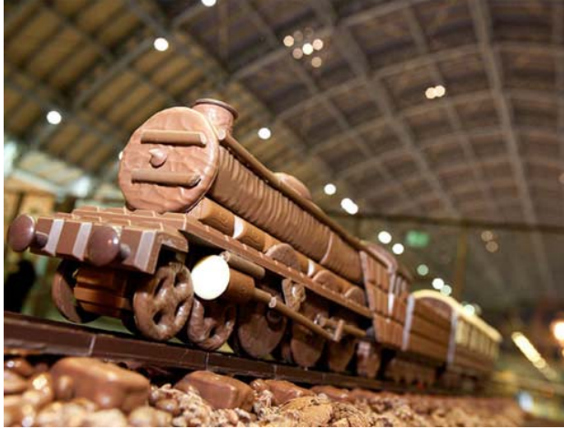
Đoàn tàu Express được làm từ chocolate.

Nhiếp ảnh gia Carl Warner đã tạo nên những bức ảnh phong cảnh tuyệt đẹp bằng chất liệu độc đáo: đủ loại thức ăn như hoa, quả, rau, bơ, bánh mì, cá, thịt... Sự sắp đặt khéo léo cộng với kỹ năng chụp ảnh đã mang đến những khung cảnh giống hệt như thực.